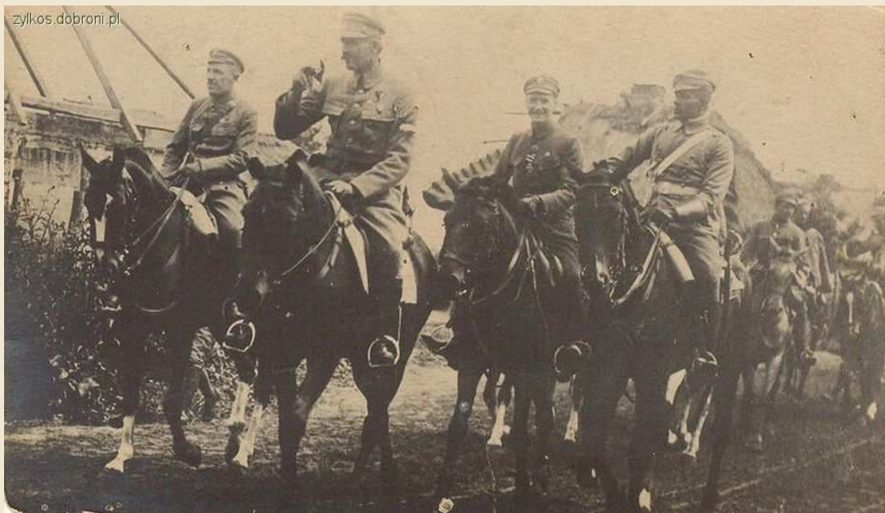
Legiony na froncie wschodnim pod Stochodem w 1916r. Piłsudski po przeglądzie brygady

Po kilku miesiącach Legiony składały się z Pierwszej Brygady walczącej w Królestwie Polskim oraz Drugiej Brygady, która uczestniczyła w walkach na froncie karpackim. Wiosną 1915 roku utworzono III Brygadę. Legiony podlegały wyższemu dowództwu austriackiemu, ale obowiązywała w nich polska komenda i umundurowanie. Jesienią 1915r. wszystkie brygady zostały skoncentrowane na Wołyniu, gdzie przez wiele miesięcy uczestniczyły w walkach z Rosjanami, m.in. w największej bitwie Legionów, pod Kostiuchnowką (lipiec 1916r). Następnie Legiony wycofały się do Królestwa Polskiego. W lipcu 1917r. doszło do tzw. kryzysu przysięgowego oficerów I i III Brygady, którzy odmówili złożenia przysięgi na wierność cesarzom Niemiec i Austro - Węgier. Zostali internowani w Beniaminowie i Szczypiornie, a legionistów z Galicji wcielono do armii austriackiej i wysłano na front włoski, zaś Piłsudskiego uwięziono w Magdeburgu. Drugą Brygadę, która przysięgę złożyła, przekształcono w Polski Korpus Posiłkowy. W lutym 1918r. jego żołnierze zaprotestowali zbrojnie wobec groźby oderwania przez państwa centralne Chełmszczyzny, przechodząc pod Rarańczą na Ukrainę i dołączając do powstałego tam Korpusu Polskiego. W Legionach walczyło blisko 25 tys. ludzi, z których wielu służyło później w Wojsku Polskim i brało udział w wojnie o niepodległość i granice Rzeczypospolitej w latach 1918–1921.