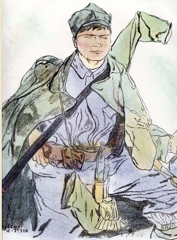
W pełnym rynsztunku