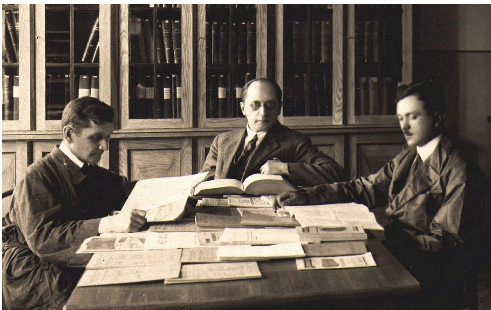
8. Biblioteka w 1926 r.