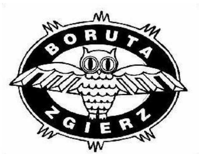
11. Logo „Boruty” z 1938 r.