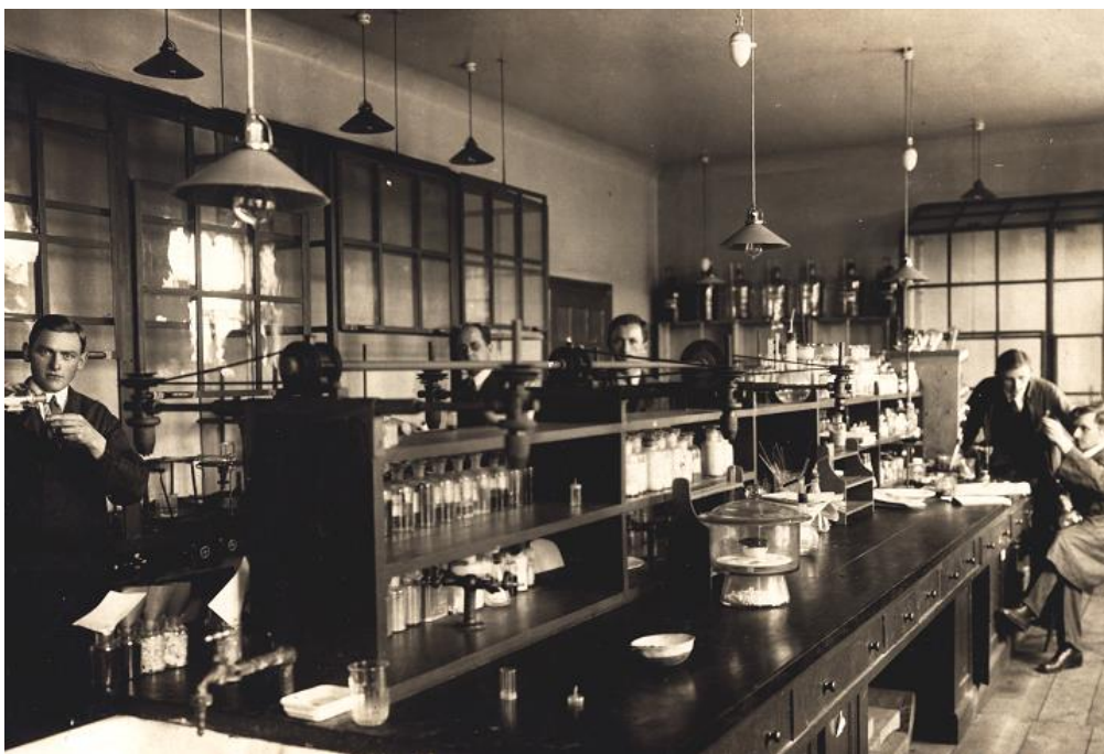
7. Laboratorium, lata 20. XX wieku.