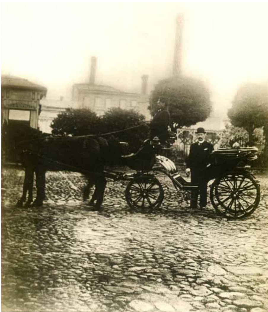
Photo 1894. podwórze fabryczne przy ul. gen. Dąbrowskiego