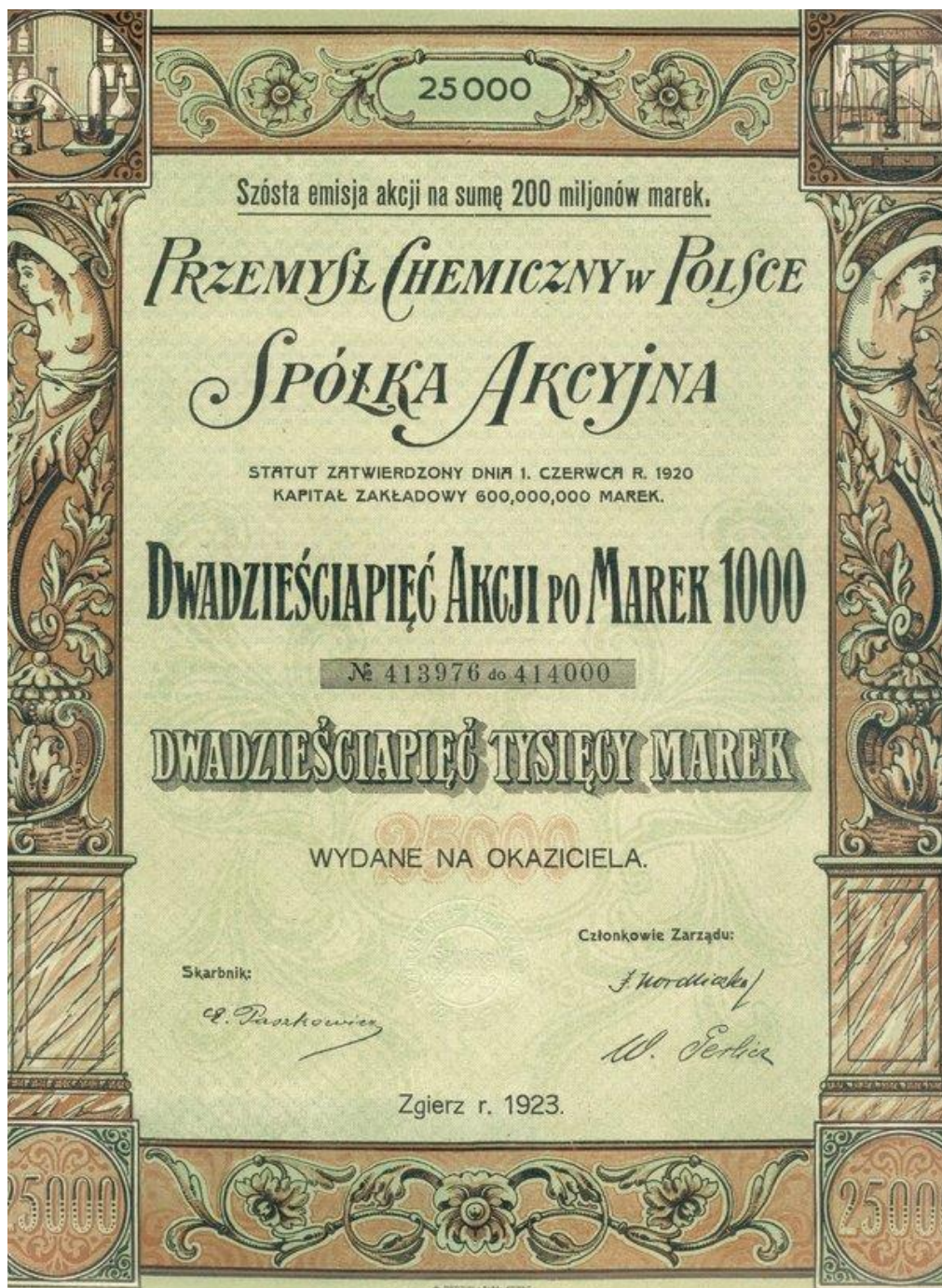
9. Papier wartościowy zakładów „Boruta” Spółka Akcyjna w Zgierzu, 1923 r.