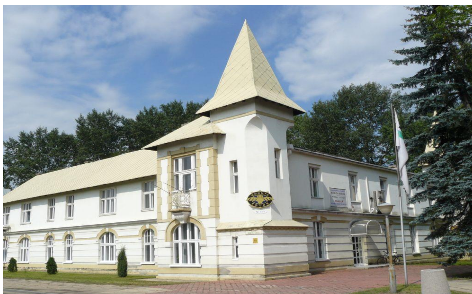
5. Pałacyk obecnie, ok. 2010 r.